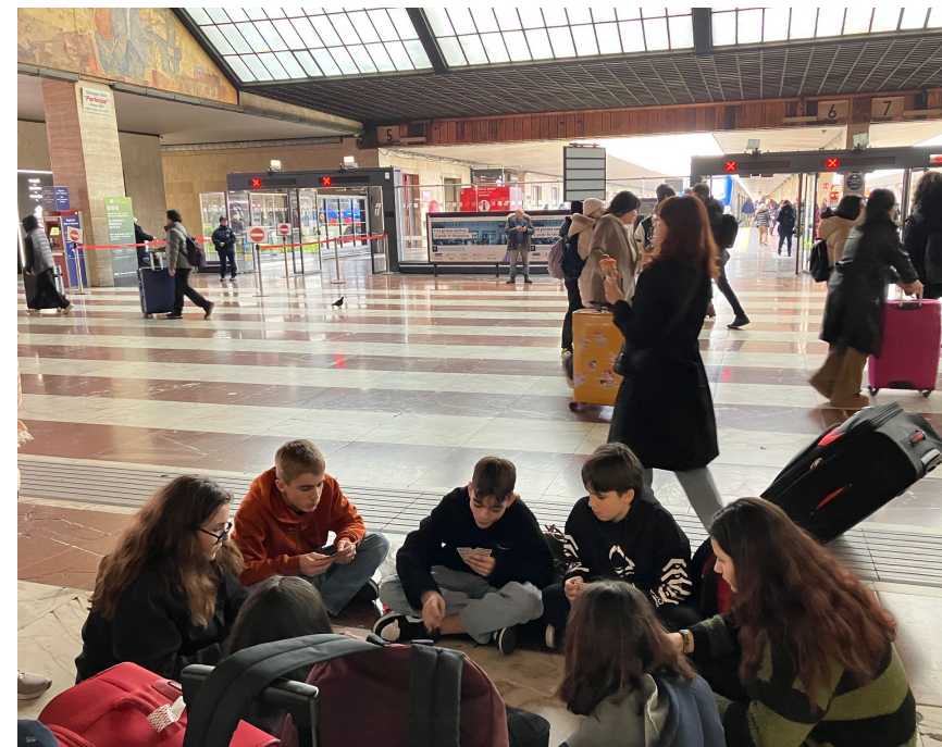
Giochi di carta