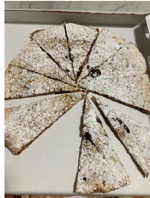
Pizza con la Nutella