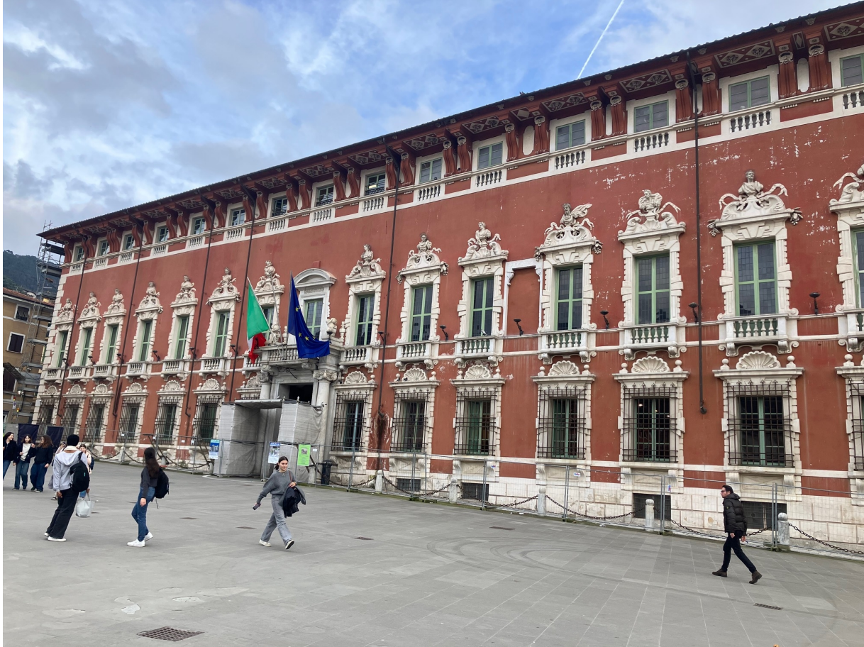
Il palazzo ducale