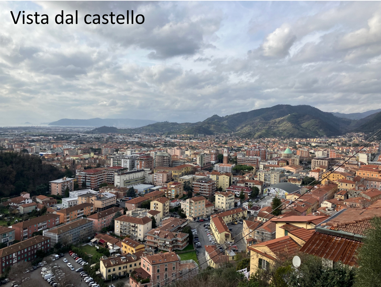
Vista dal castello