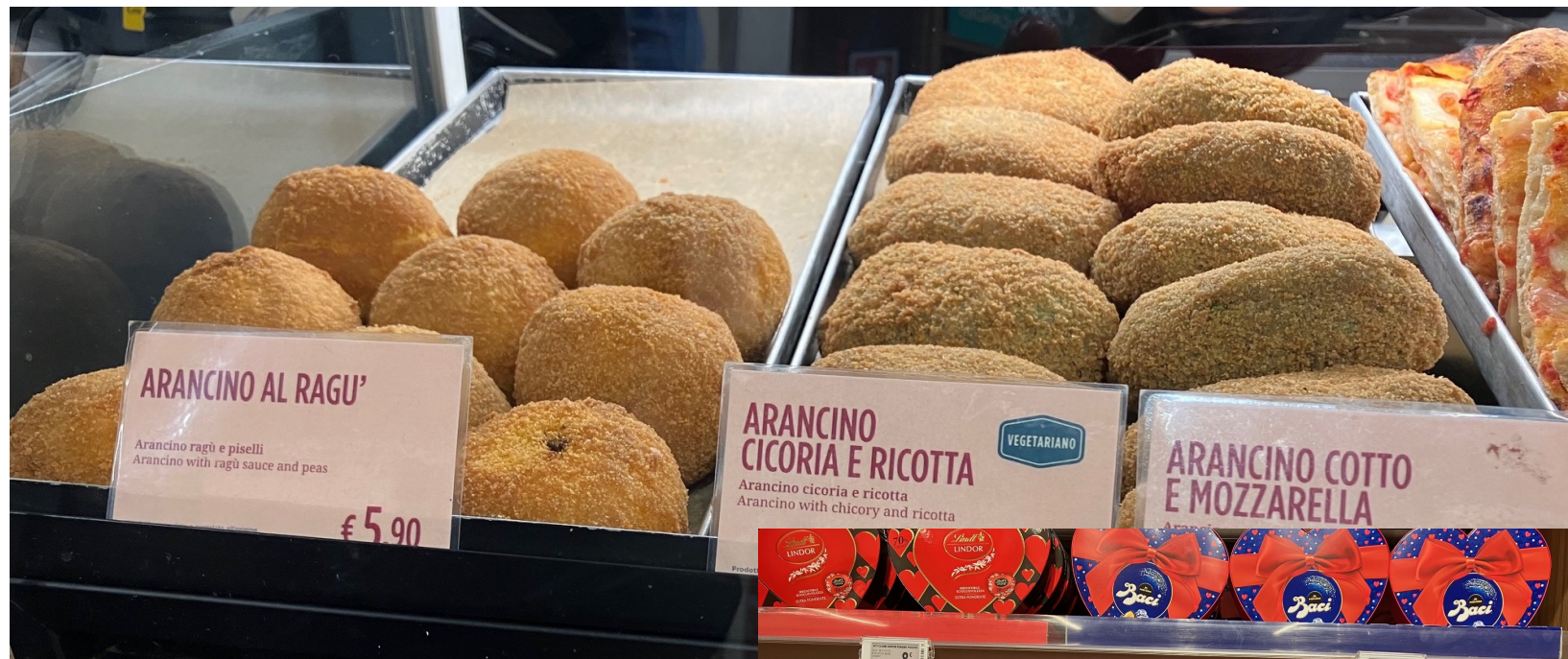
Gli arancini I baci Perugina